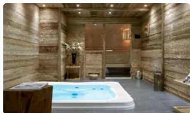
SPA LE C RÉSIDENTE LE C