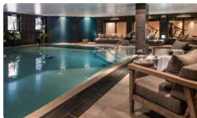
SPA MANALI MANALI LODGE